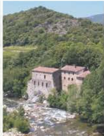
Moulin de Pradès du XIIIe s. Mill of Pradès of XIIIth century