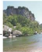
Falaises de Camps Cliffs of Camps