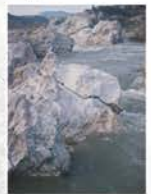
Rapide de Réals