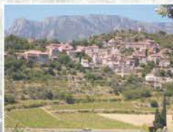
Source de Vieussan Spring of Vieussan