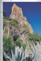
Tour de Roquebrun du Xe s. Tower of Xth century